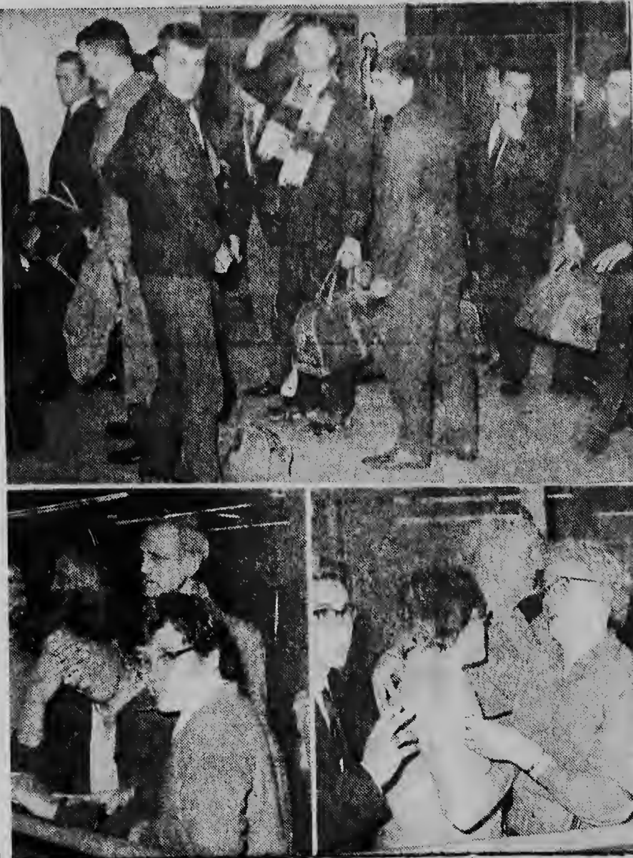
Di 60 pa 70 militar hulandes a sali diamars anochi cu e prome DC-8 di avion di linea di KLM cu desde otonjo di anja pasa ta bula trobe e ruta via Anchorage over di polo norte bai Nueva Guinea. Riba e portret aki nos por mira e bista di custumber: salida, verdriet, consuelo.

En relacion cu esaki un avion di Pan American for di Belendo Para a sali un ora y mei prome pa ateriza na Guyana i bles y sali bek prome cu e termino fatal.